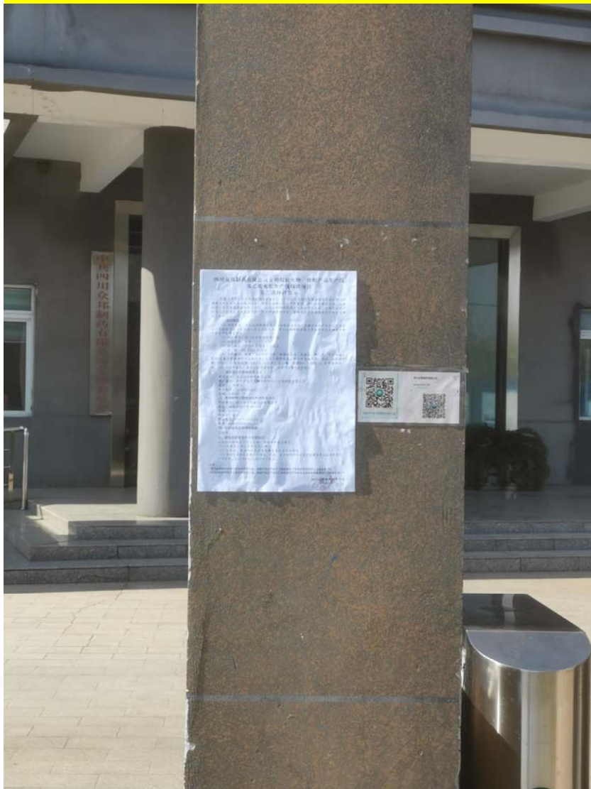
张贴位置：众邦新材料股份有限公司