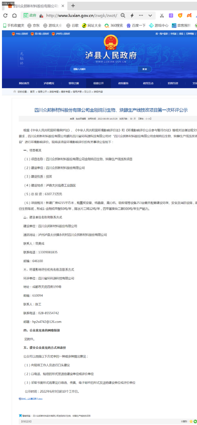
图 2-1 第一次环境影响评价信息网络公开截图