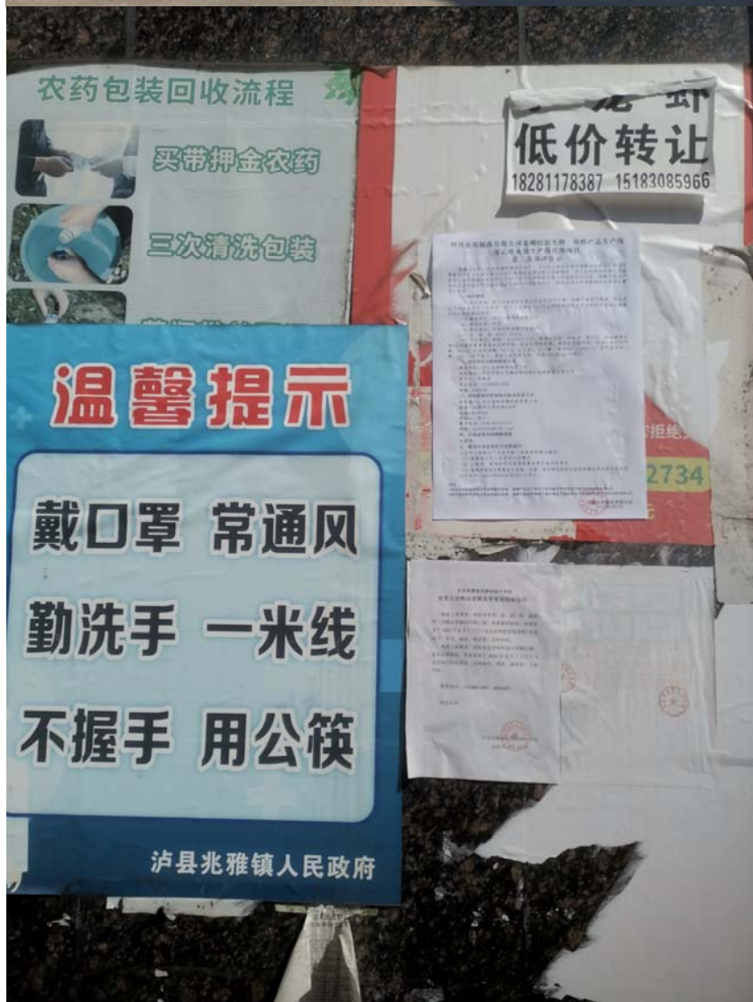
张贴位置：兆雅镇人民政府