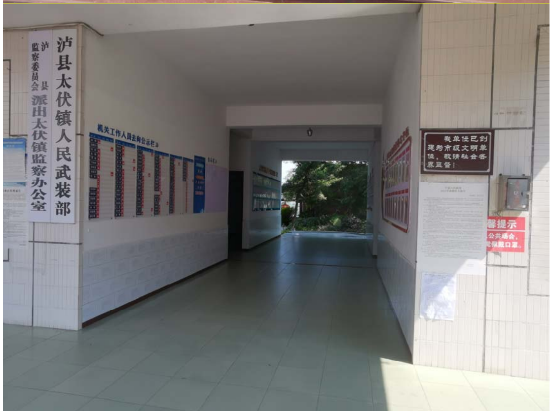
张贴位置：太伏镇人民政府