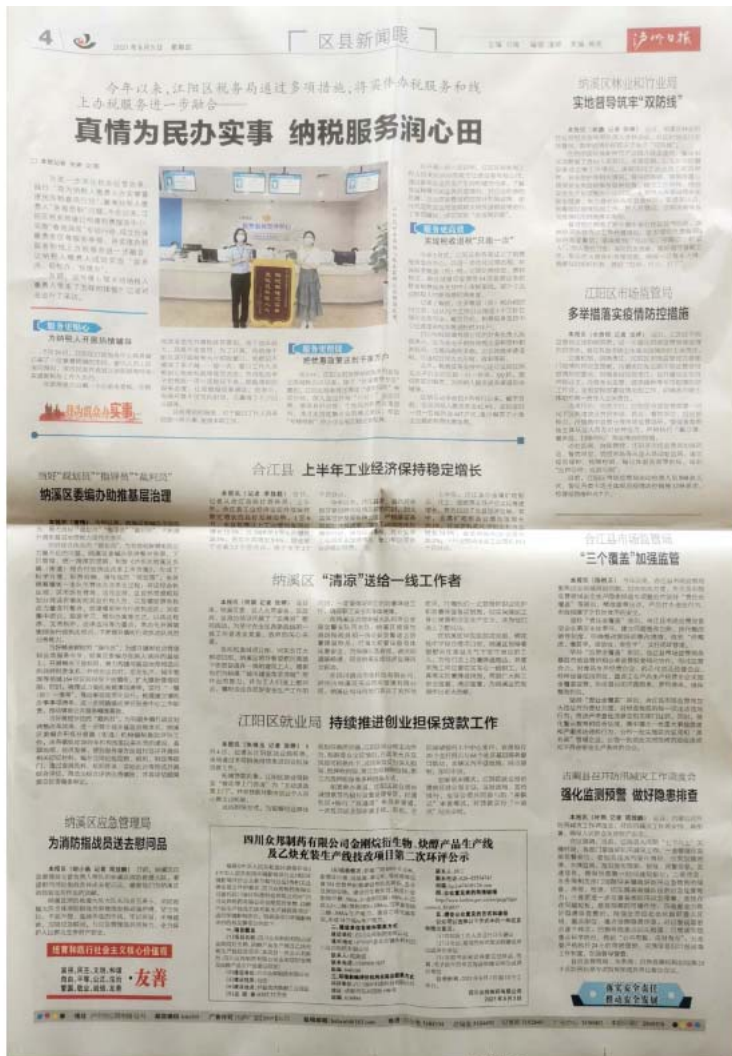
图 3-3 第二次环境影响评价信息登报公示