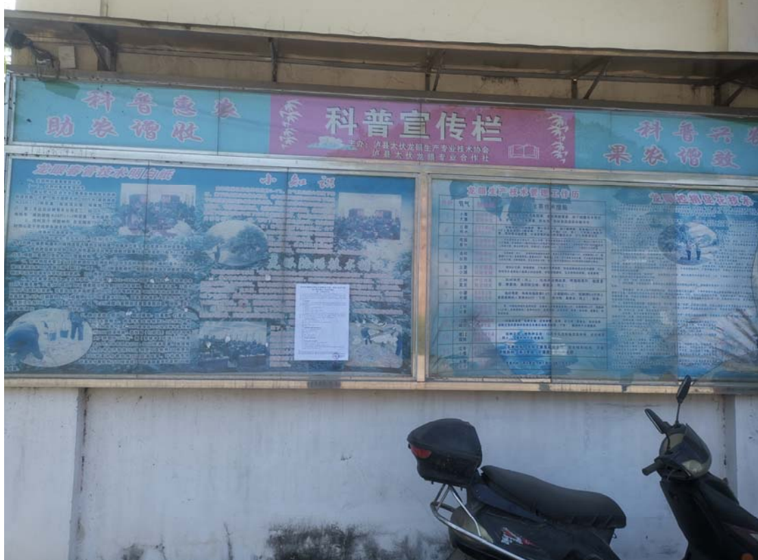
张贴位置：刺沟屋基