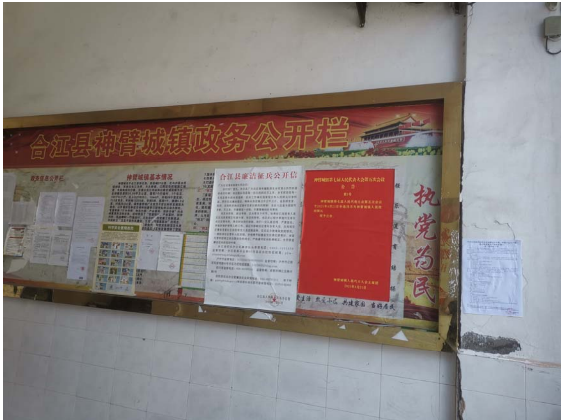
张贴位置：神臂镇人民政府