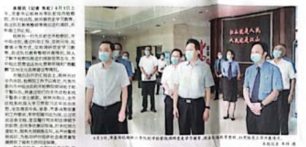
杨林兴（左二）带队调研市检察院、市中级人民法院工作。

【泸州专稿】4月23日上午，市委书记杨林兴率队深入市检察院、市中级人民法院，就护航新时代区域中心城市建设中展现使命担当进行专题调研。